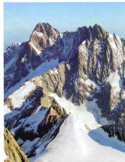
Schreckhorn a Lauteraarhorn

Nevýhodu ale spatřují především ve dvou bodech: