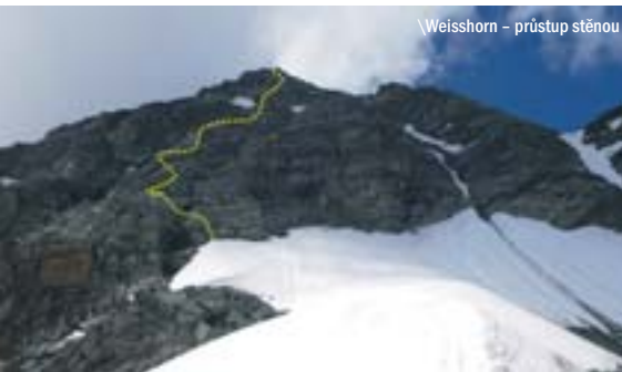
Weisshorn – průstup stěnou