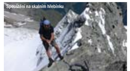
Spouštění na skalním hřebínku

5 až 7 hodin z bivaku Schalibiwak (3.750 m)