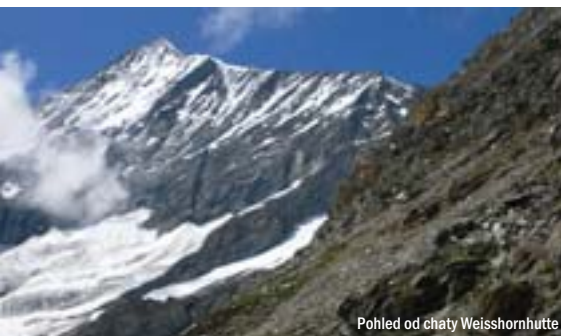
Pohled od chaty Weisshornhütte