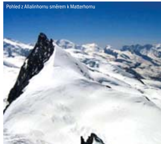
Pohled z Allalinhornu směrem k Matterhornu