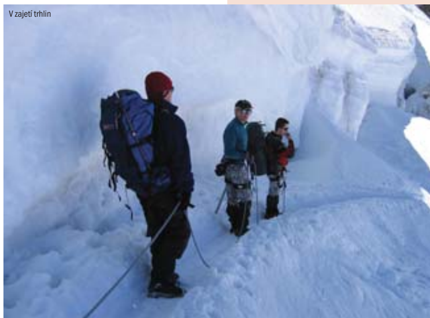
V zajetí trhlin