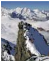
Rimpfischhorn – celý hřeben