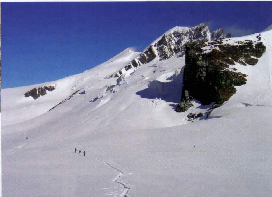
Traverz ledovce Vera