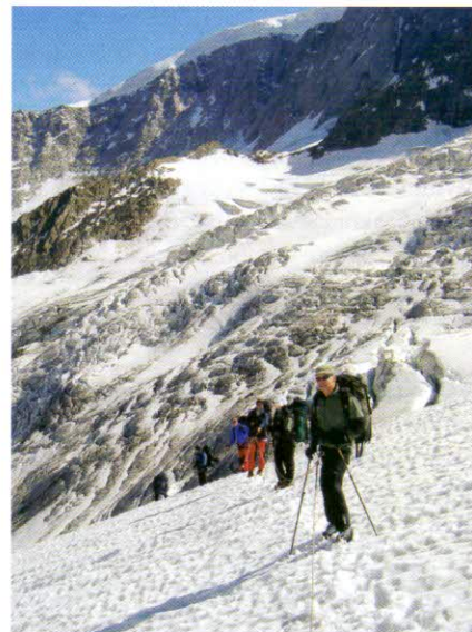
Ledovec u Mittelaletschbiwaku

Opět vyrazit okolo 04:00 a sestupovat stejnou cestou k lanovce a k autům. Dnešek můžete využít buď k regeneraci, nebo ještě vystoupit na Domhütte. Výstup sice odpovídá vypadá dost šilně (málokdy se vám podaří vidět chatu v tak závratné výšce už z parkoviště), ale nakonec zjistíte, že to není zase tak strašné. Tabule 3 – 4hodinová