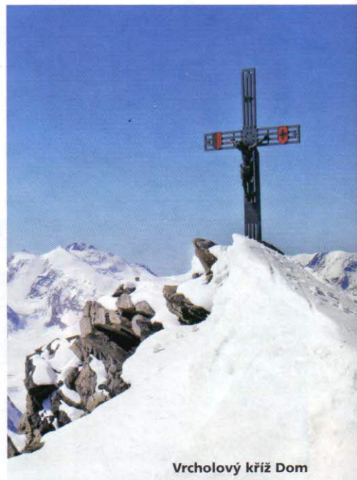
Vrcholový kříž Dom

Sestava vrcholů, se kterými vás dnes chci seznámit, je tak trochu unikátní. Nejsou sice známé tolik jako Matterhorn, ale jejich dosažení se uznává jako velmi slušný výkon. Navíc tyto vrcholy vykazují určitou výjimečnost, která spočívá v jejich těžko dostupné poloze. Kromě Aletschhornu k nim nevedou žádné lanovky, a i na samotný Aletschhorn je to od lanovky ještě hodně daleko. Dom je navíc nejvyšším kopcem, který mají Švýcaři jen pro sebe – o vyšší Dufourspitze (4634 m) ve skupině Monte Rosa se totiž dělí s Italy. Výstupy právě na tyto kopce jsou jakýmsi přechodovým stupněm mezi lehkými sněhovými výstupy širokých ledovcových stěn a výstupy exponovaným terénem či v mixových terénech.