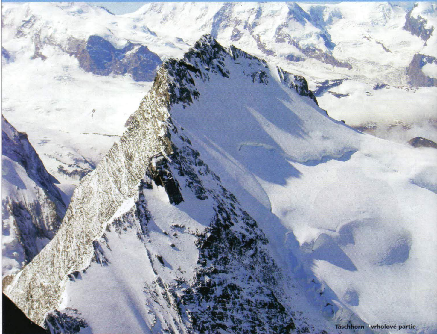
Täschhorn – vrcholové partie