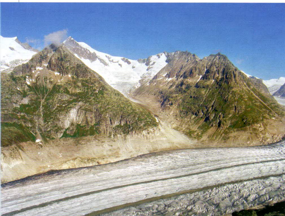
Celkový pohled na Aletschhorn

obzvláště za deště. Až se dostanete na Mittelaletschgletscher, držte se zhruba uprostřed, dokud nedojdete pod ledovcový zlom. Bivak budete mít nad sebou po pravé straně. Mimochodem – už zdálky vás na sebe bude upozorňovat svým jedinečným záchodkem. Dá se k němu vystoupat v pravé části, ale tento úsek může být velmi nepříjemný. Pohodlněji a především bez problémů se k němu dostanete ledovcem vlevo a po plošině, která je na jeho úrovni. Tato nástupová túra je zhruba na šest hodin (od lanovky až po bivak).