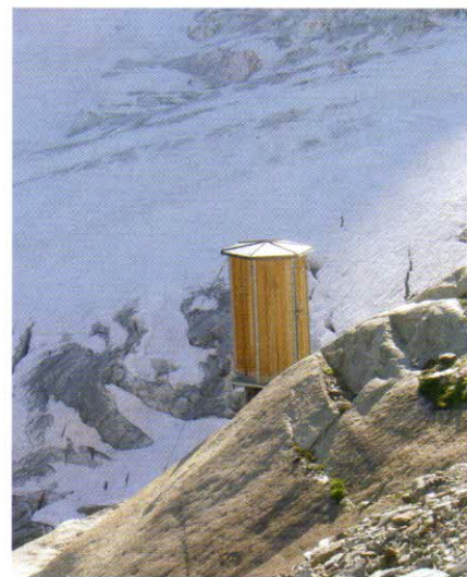
Aletschhorn – kadibudka

Pro někoho už není Täschhorn tolik motivující jako Dom, ale kdo se chce pokusit o výstup s velkým „V“, má právě teď šanci. Výstup od chaty začíná úplně stejně, ale zhruba na kótě 3500 m začnete pomalu traverzovat ledovec Festigletscher. Musíte totiž trefit sedýlko Festi Kinlücke. Výstup na něj už může být trochu problém: okrajová trhlina, strmý ledový