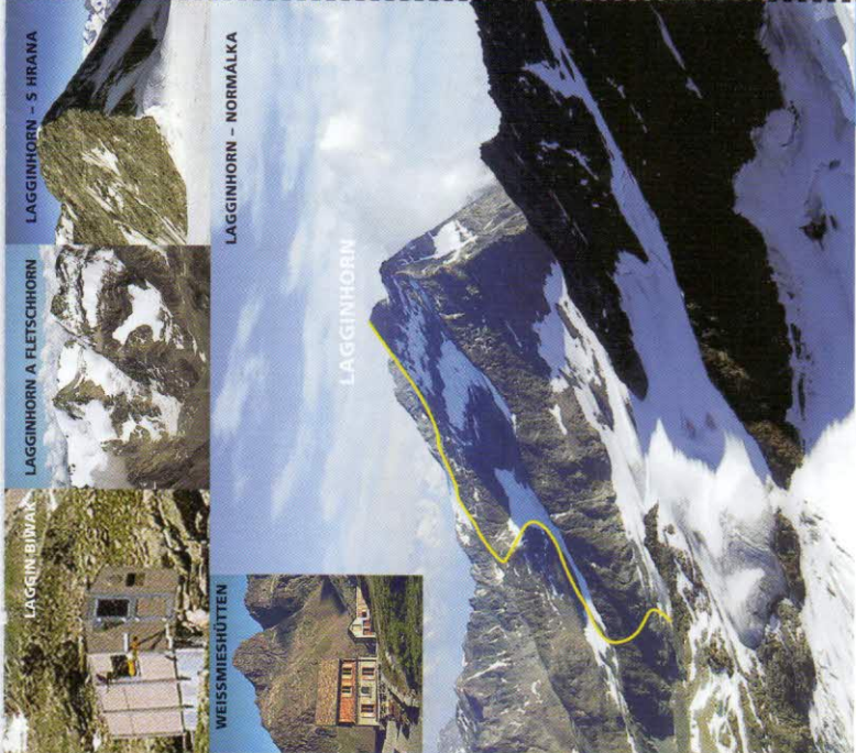
LAGGINHORN - S HRANA