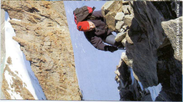
LEŽÍ ČAST SKALNÝM TERÉNU