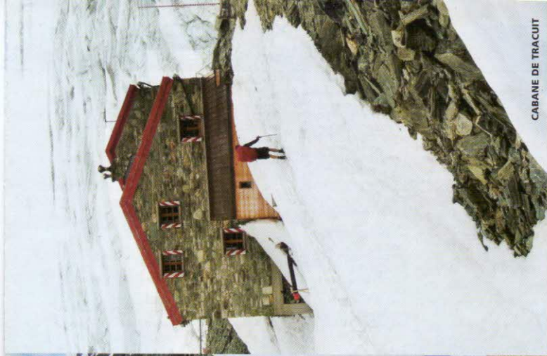
CABANE DE TRACUIT