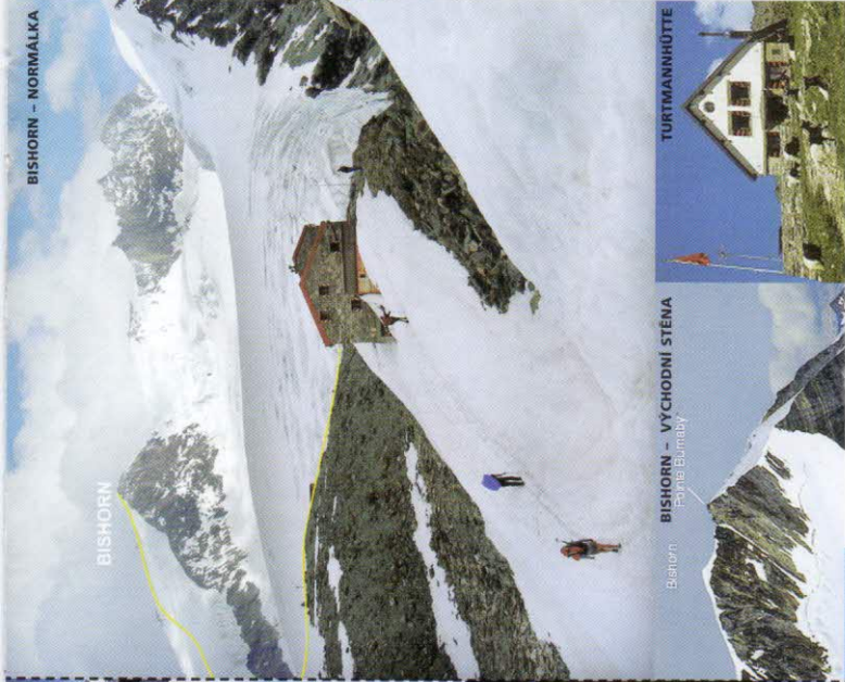
BISHORN - NORMÁLKA